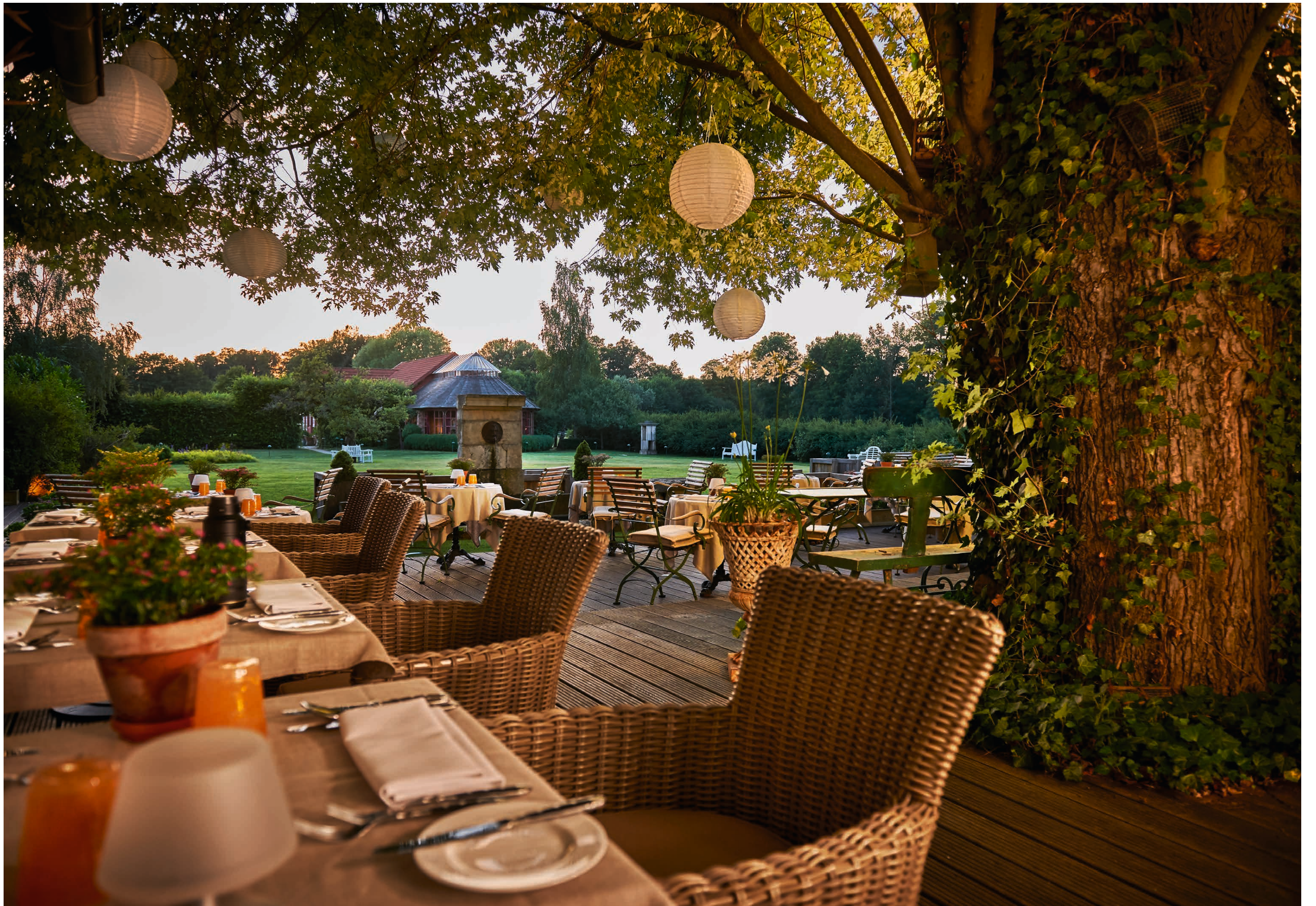
AN EINEM SOMMERABEND AUF DER BRUNNENTERRASSE