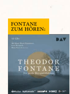
THEODOR FONTANE DIE GROSSE HÖRSPIEL-EDITION DAV – DER AUDIO VERLAG