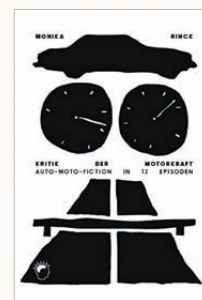
MONIKA RINCK KRITIK DER MOTORKRAFT – AUTO-MOTO-FICTION IN 13 EPISODEN BRÜTERICH PRESS

von Birgit Holler ausgewählte Leseempfehlungen zu