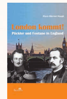
KLAUS-WERNER HAUPT LONDON KOMMT. PÜCKLER UND FONTANE IN ENGLAND BERTUCH VERLAG WEIMAR