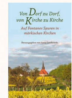
VON DORF ZU DORF, VON KIRCHE ZU KIRCHE. AUF FONTANES SPUREN IN MÄRKISCHEN KIRCHEN HRSG. VON ANTJE LESCHONSKI VERLAG FÜR BERLIN-BRANDENBURG